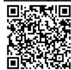
IBILBIDEAK / RUTAS PR-BI 220