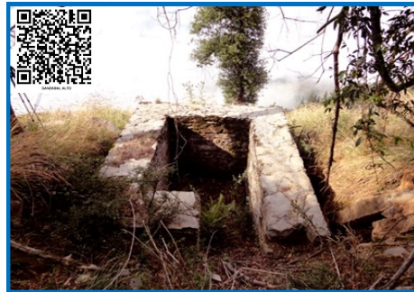
ABRIGO PASIVO GANZABAL 01