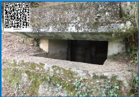
ASENTAMIENTO AMETRALLADORAS TARAMONA 02