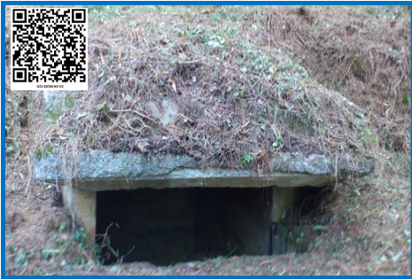
ASENTAMIENTO AMETRALLADORAS GOLDEBANO 02