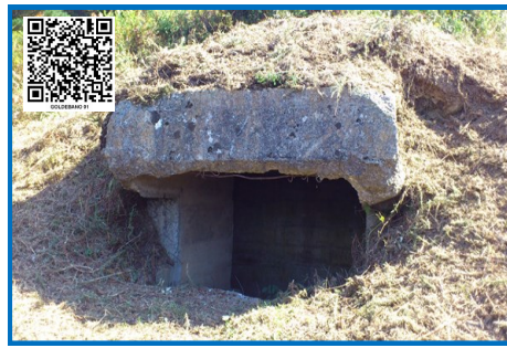
ASENTAMIENTO AMETRALLADORAS GOLDEBANO 01