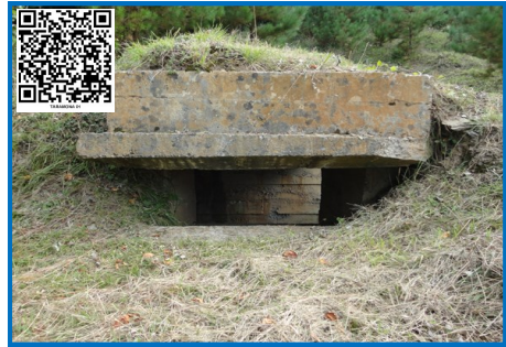
ASENTAMIENTO AMETRALLADORAS TARAMONA 01