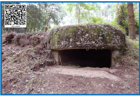
ASENTAMIENTO AMETRALLADORAS ARBORI 01