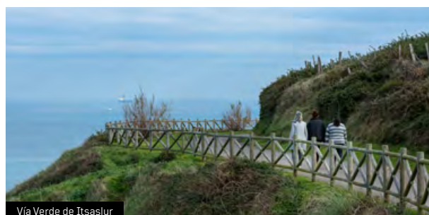
Vía Verde de Itsaslur

➔ Una vez salvado este primer escollo, el camino se hace mucho más amable, lo que nos permitirá centrarnos en el espectacular paisaje de la desembocadura del río Barbadun y de la playa de La