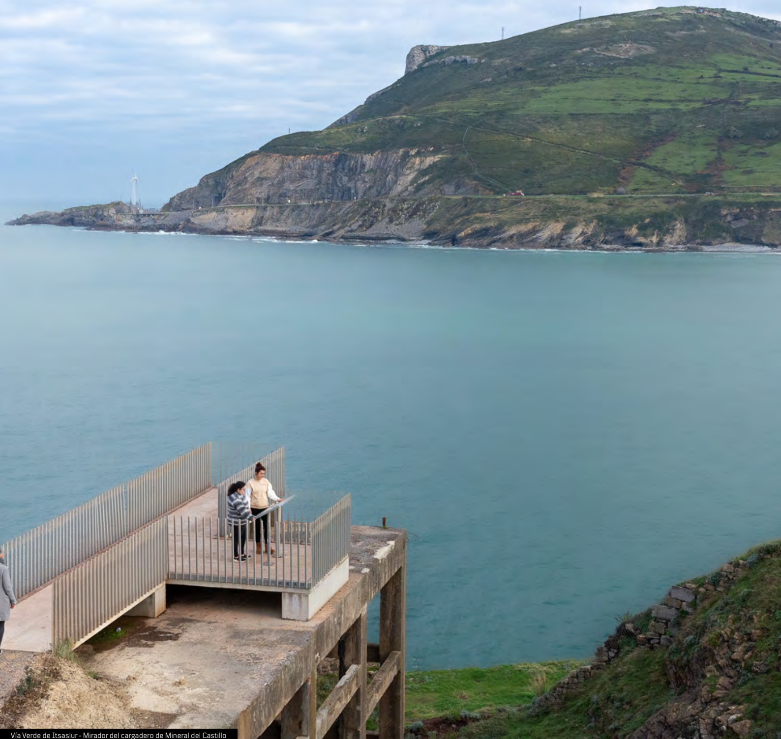
Vía Verde de Itsasur - Mirador del cargadero de Mineral del Castillo

destacan los dos hornos de calcinación de la mina Amalia Vizcaína, construidos en 1900 en el barrio de Kobaron, que aún siguen en pie, aunque llenos de vegetación, y los restos del monumental cargadero de mineral del Castillo , asociado al ferrocarril con el que la Compañía McLennan sacaba el hierro de las minas circundantes y lo ponía rumbo a tierras inglesas. En 2008 una tempestad marina arrancó su estructura metálica, pero aún se conserva su impresionante base cimentada de piedra. Único en su género en Bizkaia, constituye una de las imágenes de mayor reclamo iconográfico de todo el coto y un impresionante mirador al mar.