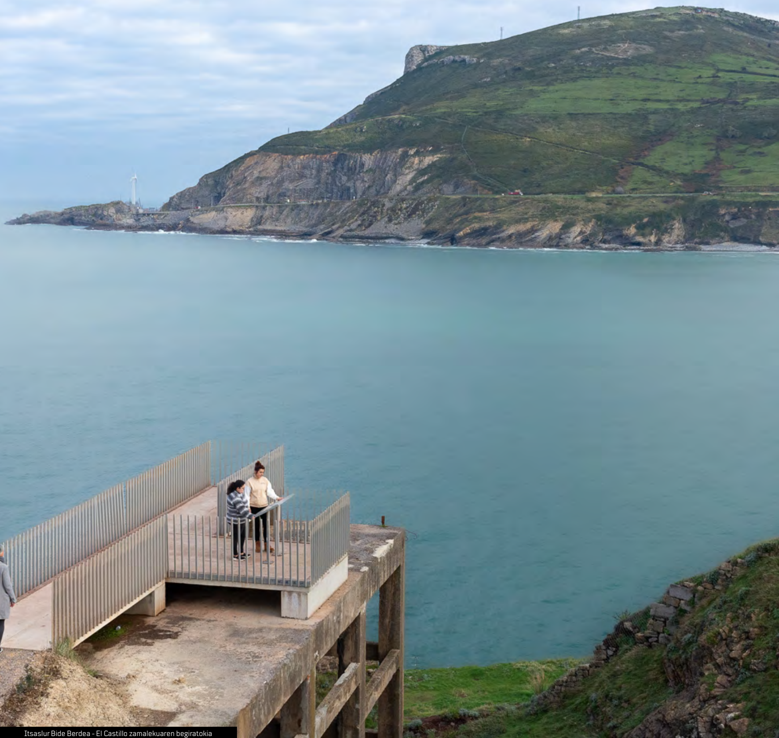
Itsasur Bide Berdea - El Castillo zamalekuaren begiratokia

Horiek horrela, itsaslabarren ertzeko ibilbidea ez ezik (antzinako burdinbidearekin bat egiten duena), nabarmentzekoak ere dira Amalia Vizcaína meatzeko bi errauste-labeak, 1900. urtean Kobaron auzoan eraikiak eta oraindik ere zutik daudenak, landaretzaz beteta egon arren, eta El Castillo zamalekuaren hondakinak. McLennan konpainiak inguruko meategietatik burdina ateratzeko eta Ingalaterrarako bidean jartzeko erabiltzen zuten trenbideari lotuta zegoen zamaleku hori. 2008an, itsasoko ekaitz batek haren metalezko egitura erauzi zuen, baina oraindik ere harriz zimendatutako oinarri ikusgarria kontserbatzen da. Ez du parekorik Bizkaian. Erakarmen