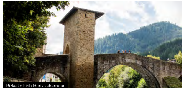
Bizkaiko hiribildurik zaharrena

➔ La Encartada bisitatu ondoren, ez galdu Balmasedan paseatzeko eta bazkaltzeko aukera. Bizkaiko hiribildurik zaharrena izanik, monumentu-multzo izendatu zuten bertako hirigune historikoa 1996an. Gaztelaren eta Kantauri itsasoko portuen arteko leku estrategikoan egonik, Bizkaiko merkataritza-gune garrantzitsuenetako bat izan zen aspaldi batean. Erdi Aroko kale-egituraren zati handi bat bere horretan mantendu du 1199ean hiribildu izendatu zutenetik. Ondare historiko nabarmena dago alde zaharrean; besteak beste, Zubi Zaharra eta San Severino plaza.