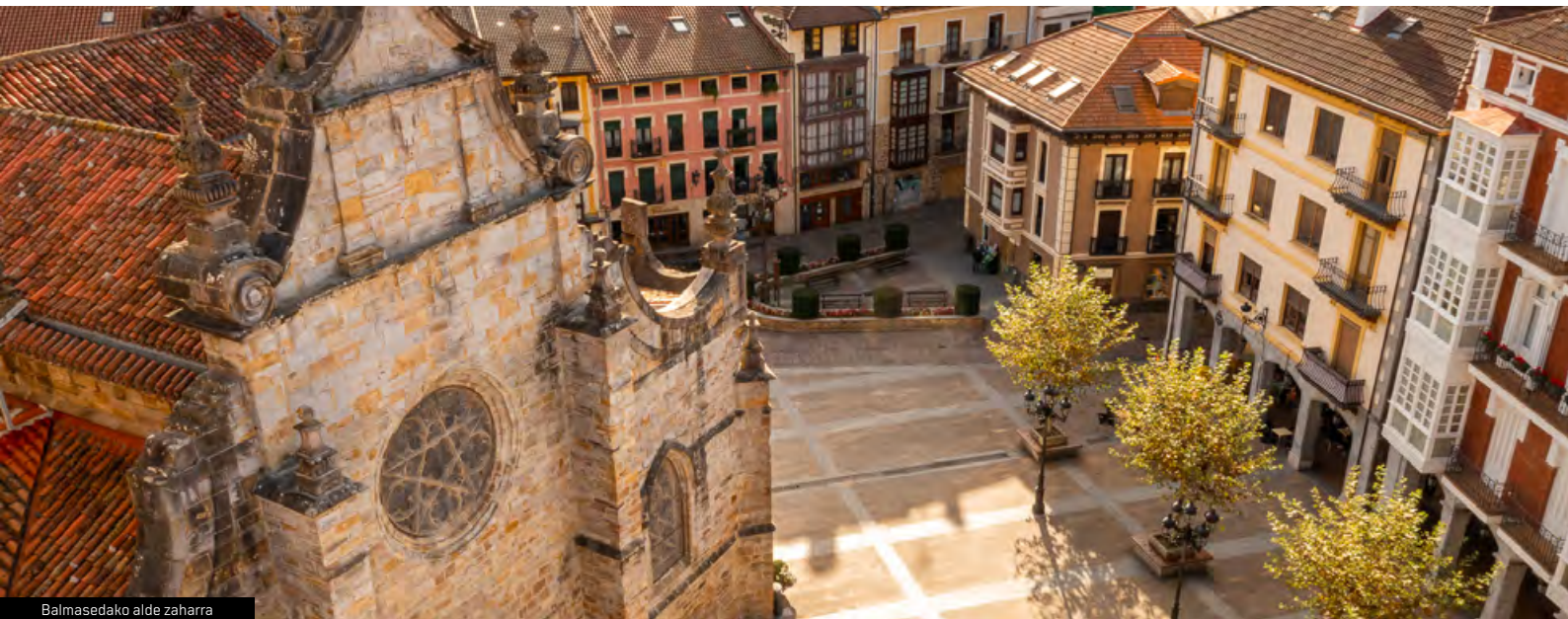
Balmasedako alde zaharra

➔ Erdi Aroko kaleetan barrena ibiltzeaz gain, gatzeluko muinora igotzea proposatzen dizugu. Haranaren gaineko kokapen estrategikoagatik, hiribildua erabat inguratzen zuen gotorleku harresitu bat eraiki zuten muinoan XIII. mendean. Gaur egun, errealitate birtualari esker, denboran bidaiatu, eta zure begiekin ikusi ahalko duzu Balmasedako gatzeluaren muinoa eta hirigune historikoa nola itzultzen diren bizitzara hainbeste mende geroago.