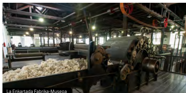
La Encartada Fabrika-Museoa

Lantegiaren inguruan langile-kolonia txiki bat garatu zen, La Encartadan lan egiten zuten familientzako etxebizitzekin eta kapera-eskola batekin. Auzune berean baratze batzuk eta zuzendariaren etxea zeuden, jada desagertuta dagoena.