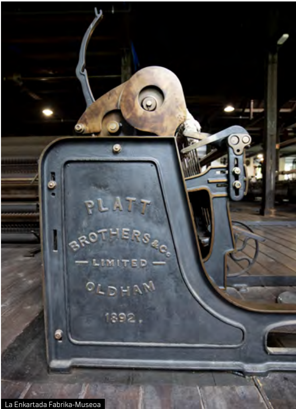
La Encartada Fabrika-Museoa

dira gehienak, XIX. mendearen amaierakoak eta XX. mendearen hasierakoak. Bere horretan gorde dira lantegiaren irudia eta dotazio teknologikoa urteetan zehar, adibidez, oso-osorik mantentzen dira ekoizpen-prozesuaren elementu guztiak, lehengai gordin jasotzen denetik, paketatzeko eta bidaltzeko prozesura arte. Osotasun tekniko hori eta kontserbazio-egoera bikaina direla-eta, La Encartada bisita dezakegun parekorik gabeko esparrua da.